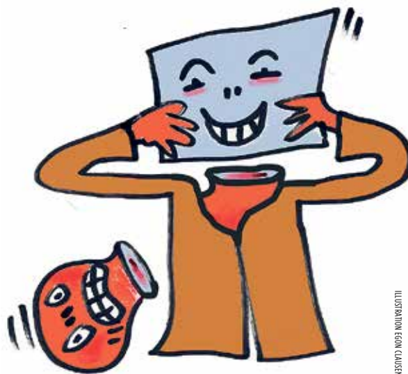
ILLUSTRATION Egon Clausen

Den første kategori består af skrivende mennesker, hvis primære publikum er dem selv. De findes i alle medier, men den mest ekstreme udgave finder man på de sociale medier, hvor skribenter, der knap kan skrive, kaster sig ud i frådende opgør med alt, hvad der kan ophidse dem, og det er ikke så lidt. Som gyllespredere sprøjter de om sig med fordomme, forbandelser og stavfejl. En egentlig debat er der praktisk taget aldrig tale om. Andres tekster fungerer kun som tændsætter for deres raseri, men til gengæld er det tydeligt, at de er meget forelskede i deres egne tekster. Man