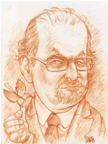
Fatwaen mod Salman Rushdie satte gang i debatten om ytringsfriheden.

Det har skærpet opmærksomheden på ytringsfriheden, at kunstnere og debattører er blevet truet på livet, og det har været med til at lægge et vist pres på, at tegnere og forfattere skal komme med markante meninger. Faktisk virker det provokerende på dele af offentligheden, hvis vi ikke vil – hvis vi bliver for pæne, bange eller bare for dovne til at bruge retten til at sige tingene ligeud. Folk med ordet og pennen i deres magt forventes at gå forrest med at forsvare ytringsfriheden.