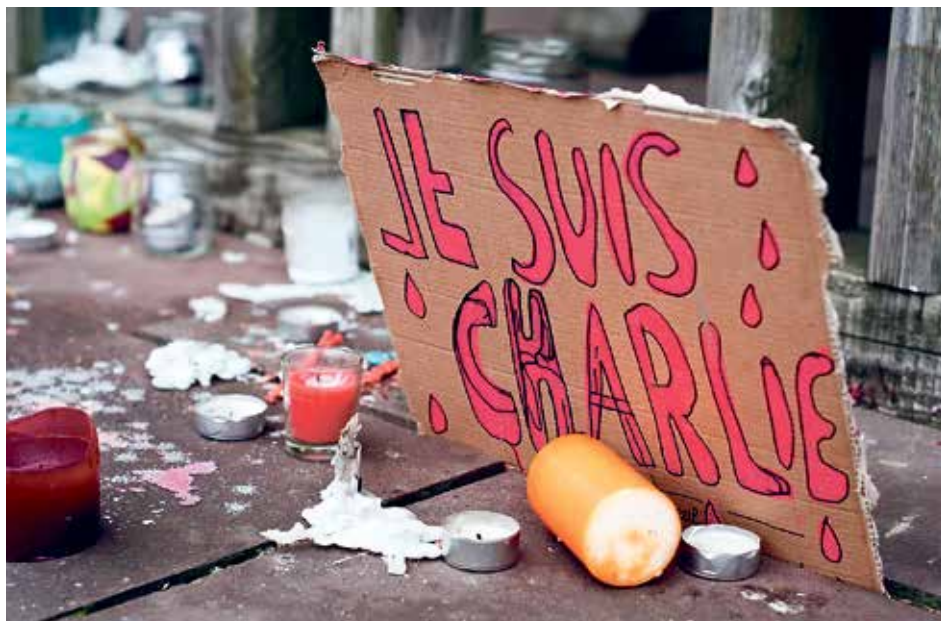
Lige efter angrebet på Charlie Hebdos redaktion i januar 2015 mærkede medarbejderne stor opbakning. Men i dag siger de, at de føler sig alene i kampen for ytringsfriheden.