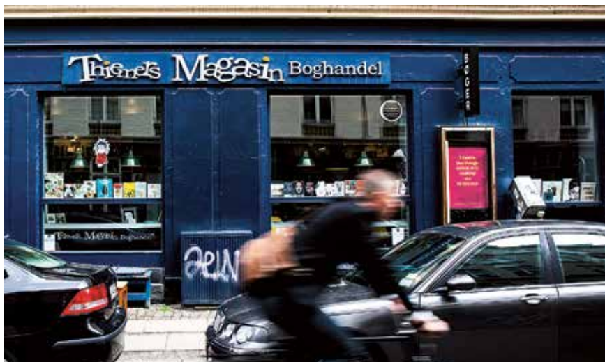
Thiemers Magasin kombinerer boghandel med aktiviteter, der fokuserer på læsning og litteratur.