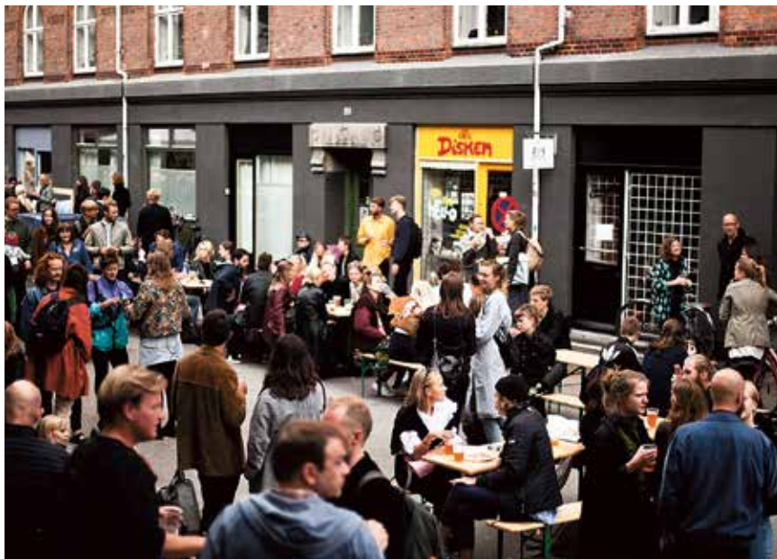
LiteraturHaus en sommerdag.