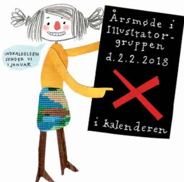
ILLUSTRATION: KAREN LANGE

Der kommer indkaldelse med mere information i starten af det nye år.