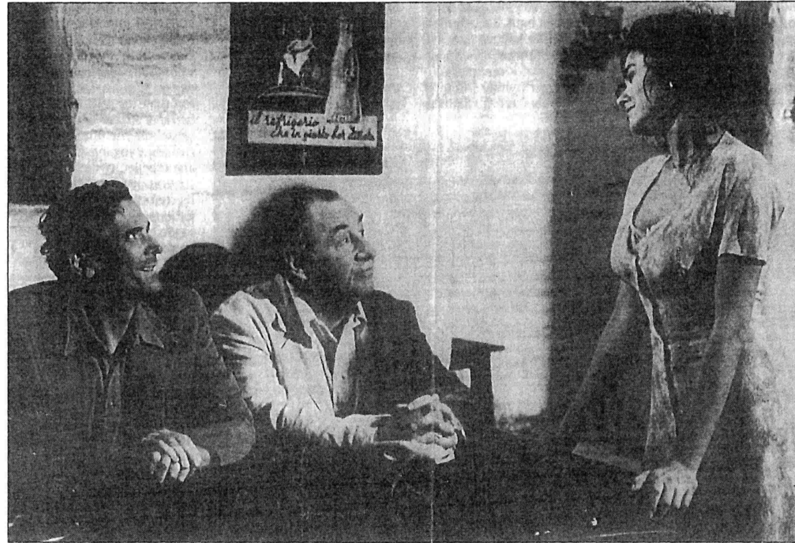
Postbudet (Massimo Troisi), digter Neruda (Philippe Noiret) og den attræde Beatrice (Maria Grazia Cucinotta) i »Postbudet« – en befriende morsom formuleret hyldest til poesi og forelskelse.

en bypass-operation og stod på venteliste til en hjerte-transplantation. Ved nyheden om hans tidlige død kom jeg og sikkert mange andre napolitanere i tanke om en af hans film, som hedder »Troisi er død, leve Troisi!«. Selv om han måske allerede dengang følte døden som nærværende, er det en uhyre morsom film at tænke tilbage på.