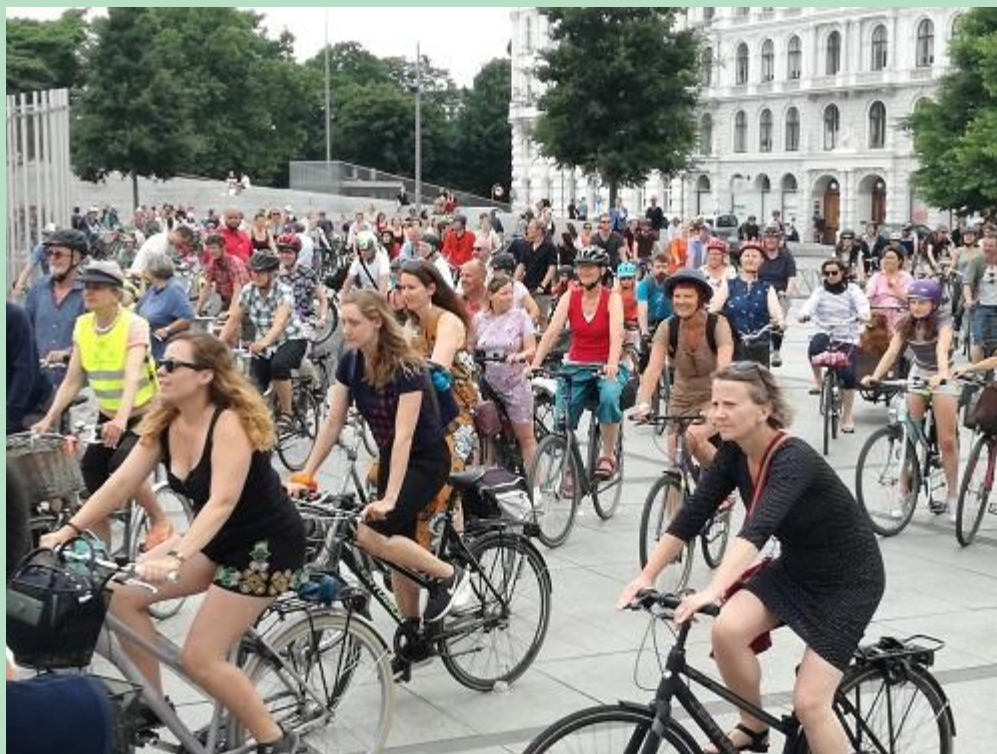
Israels Plads, København.

Et kursus, som gennem oplæg og ideudvekslinger viser veje til, hvordan fag- og skønlitteratur samt illustrationer og lyrik alle kan bidrage til en alsidig formidling af viden om en bæredygtig udvikling.