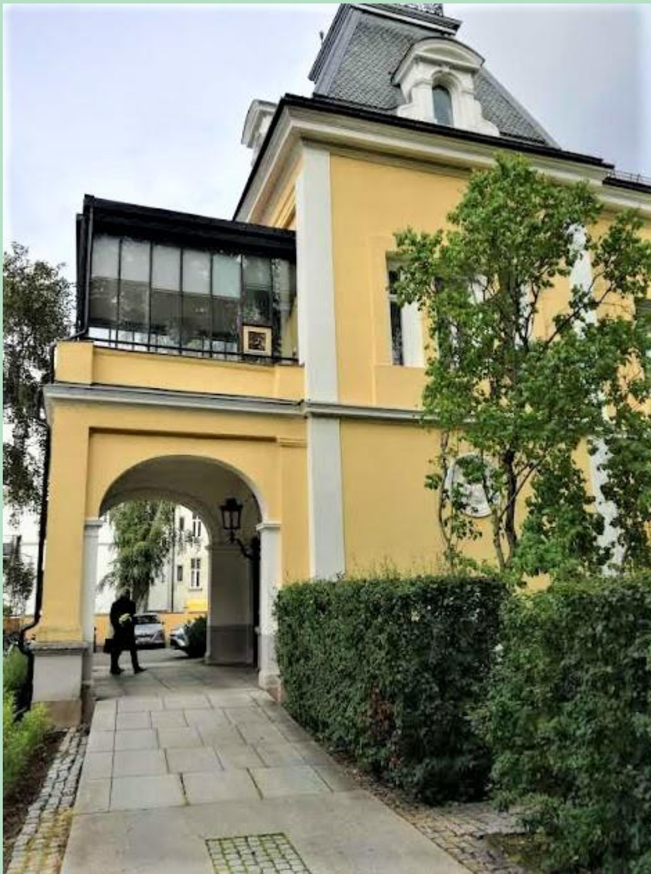
NFFOs kontor i Oslo.

Den faglitterære styrelse deltager i et samarbejde med de øvrige nordiske forfatterforeningers styrelser. Dette samarbejde har eksisteret siden 2003, hvor den første konference blev afholdt i Visby på Gotland.