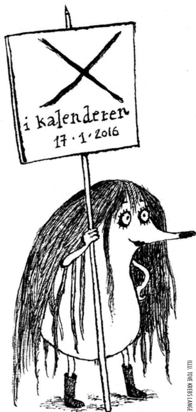
ILLU. TORIE KRISTENSEN

Efter præsentationerne vil der være almindelig cirkulæren med pindemadder og mulighed for at lykønske hinanden og høre mere om bøgerne. Man er velkommen til i dagens anledning at iføre sig festligt tøj, ordensbånd, tiara eller uniform.